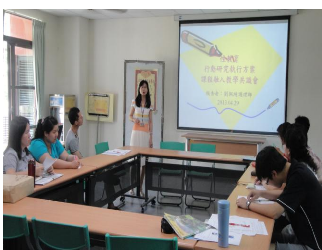
護理師將性教育問卷統計結果與相關領域教師共同召開課程融入教學共識會議