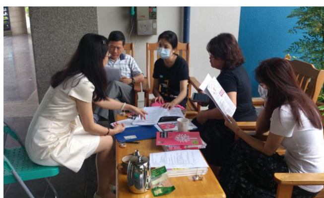
與綜合輔導領域教師討論課程介入內容