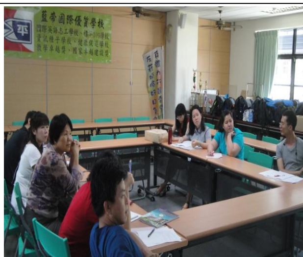
相關領域教師意見交流，討論介入方案