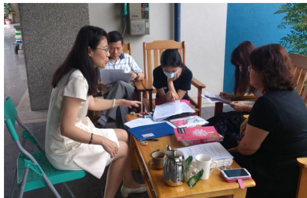
小組討論排定時間