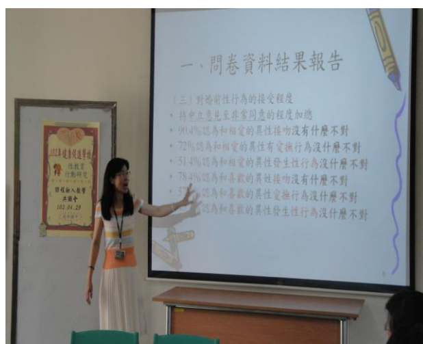
護理師報告性教育問卷學生填答結果