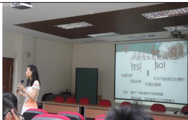
設定問題情境，安排學生分組討論