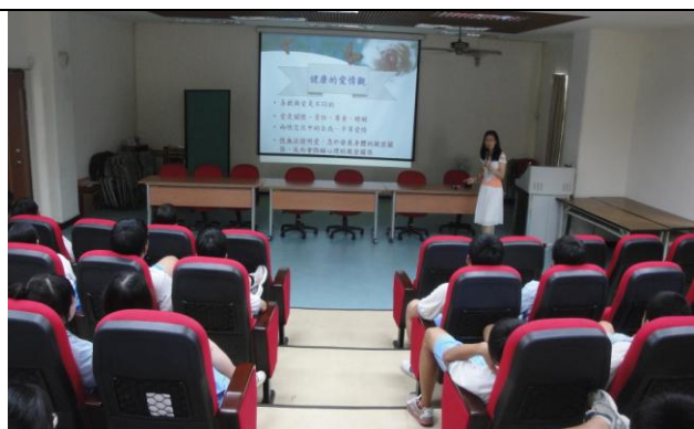
健康愛情觀—關懷、責任、互重