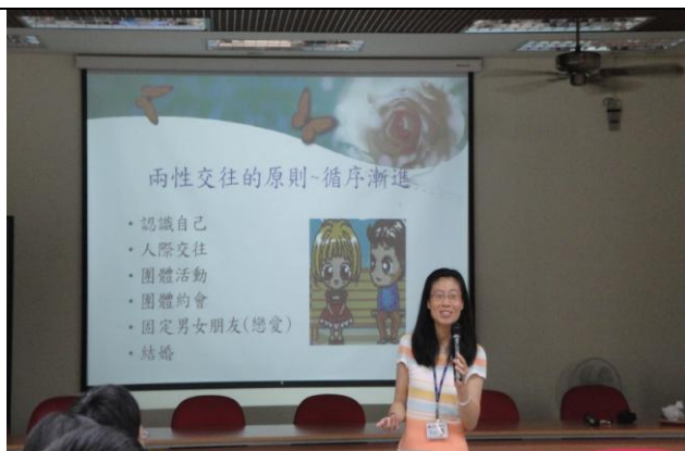
兩性交往原則--循序漸進