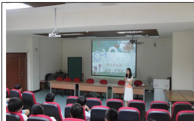
向學生介紹授課內容大綱