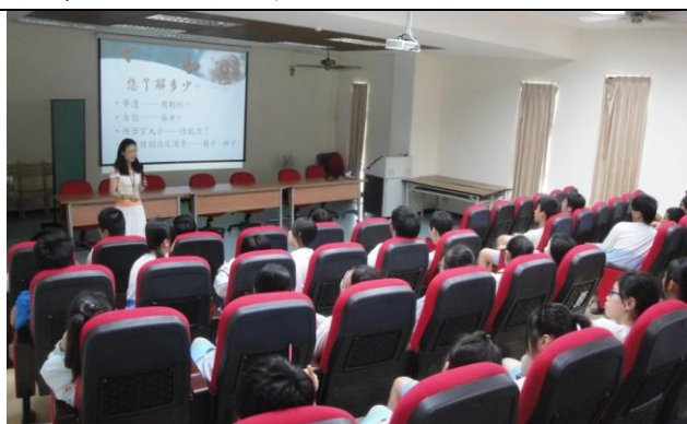
互動時間—解答性議題疑惑