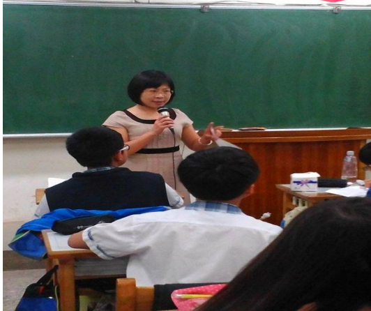
說明：護理師於班上宣導行動研究議題『安全教育與急救』實施後測前之介入措施