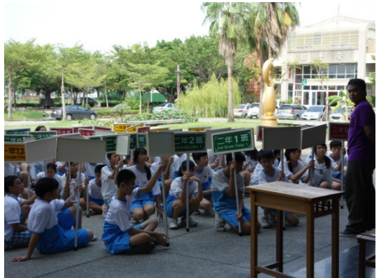
說明：生教宣導避災動作