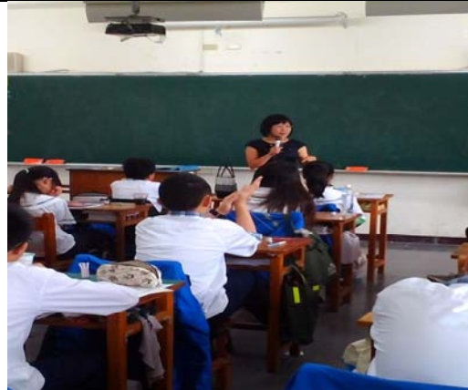
說明：護理師於班上宣導行動研究議題『安全教育與急救』實施後測前之介入措施