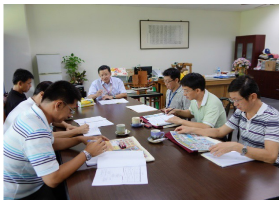
說明：教育局長官視導座談