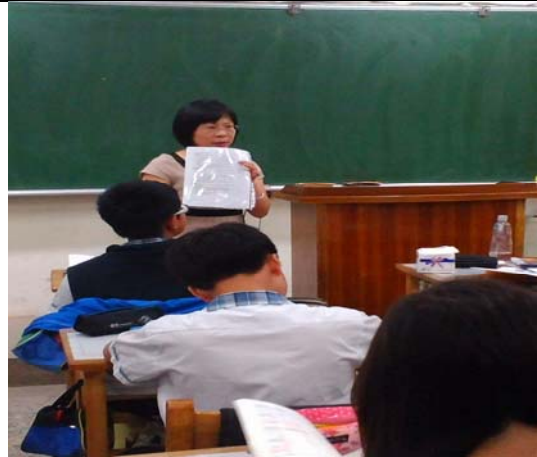
說明：護理師於班上宣導行動研究議題『安全教育與急救』實施後測前之介入措施