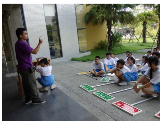
說明：生教宣導避災動作