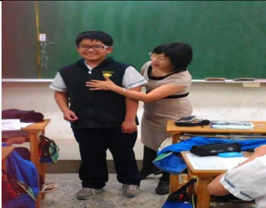
說明：護理師於班上宣導行動研究議題『安全教育與急救』實施後測前之介入措施