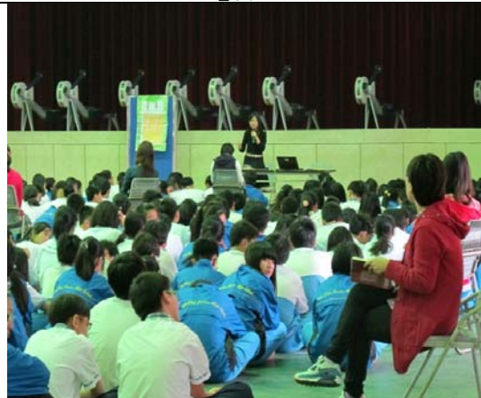
說明：結合安平衛生所和樹人醫專於103年4月7日共同推動校園意外事故防治與正確急救觀念安全教育宣導活動。