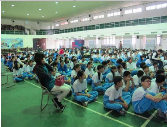
說明：結合安平衛生所和樹人醫專於103年4月7日共同推動校園意外事故防治與正確急救觀念安全教育宣導活動