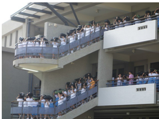
說明：全校師生避災動作演練