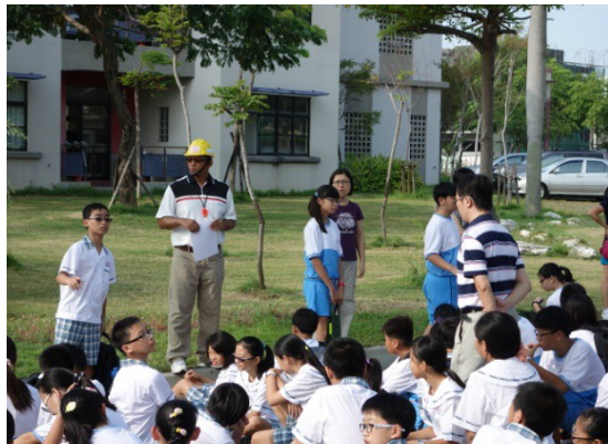
說明：防災演練宣導