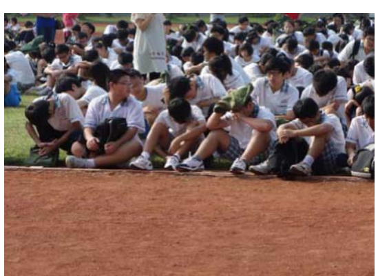
說明：全校師生避災動作演練