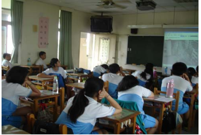
健康與體育領域教師將菸害防制融入課程