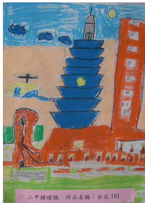
二甲鍾曜聰 作品名稱：台北 101