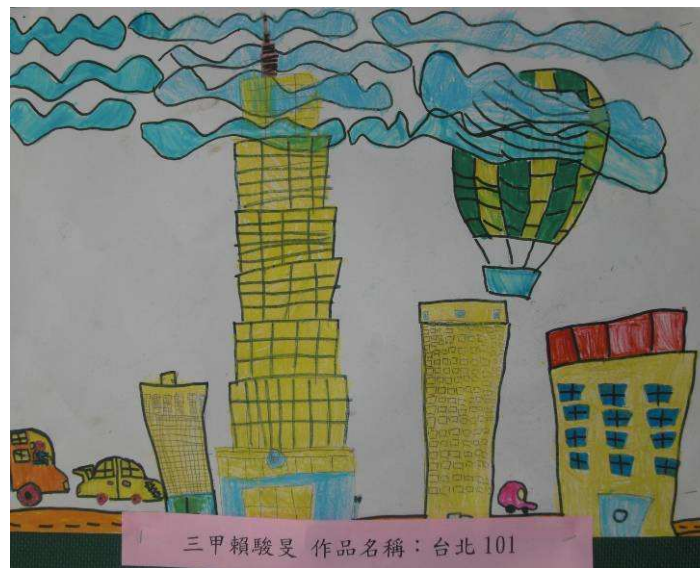
台北 101 三甲賴駿旻