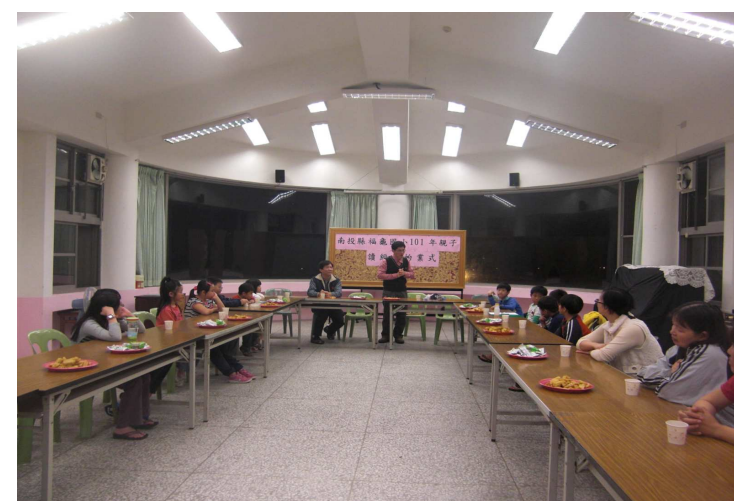
3月16日福龜國小讀經班始業式