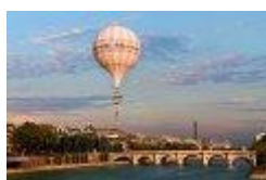
AROUND THE WORLD, THE MOVIES !?!