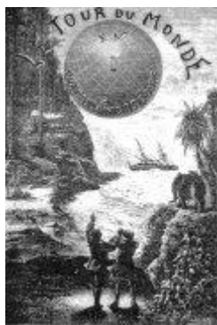
LE TOUR DU MONDE EN QUATRE-VINGT JOURS

Phileas 是否和 Passepartout 將做它回到倫敦在 80 天之內？