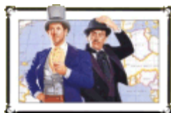
BOOK COVERS OF THE JULES VERNE'S NOVEL