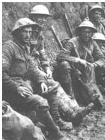
在戰壕裡作戰的士兵

1916年 春，俄國調集3個方面軍共200萬人向德奧聯軍發動反攻，在激戰一輪後，雙方各損失百萬兵力，但俄軍兵力較多，因此逼退德奧聯軍，並乘勝攻進 加里西亞 東部地區，史稱 勃魯希洛夫攻勢 （勃魯希洛夫爲當時的俄軍總參謀長）。羅馬尼亞亦於該年 8月 向同盟國宣戰。德奧聯軍於是決定攻取羅馬尼亞，以奪取石油和糧食補給。結果羅馬尼亞首都 布加勒斯特 很快便失陷，德奧軍隊佔領大部分羅馬尼亞國土。