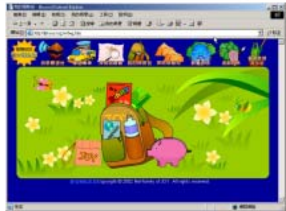
【圖六】我的探險包圖

■ 我的探險包：此為學習者專屬的個人化服務，同時也是個人學習歷程的檔案紀錄區，內有「我的日記本」、「我的存摺本」、「我的網站撲滿」、「我的護照」等功能區。「我的日記本」有提供日記小精靈輔助兒童日記寫作，並可分享或不分享自己的日記，讓學習者在網路上也可以欣賞同儕的作品，甚至能將他人的日記「加入好友」。「我的存摺本」為線上人際關係管理工具，可以開帳號給重要他人、紀錄重要他人的資料與通訊錄，並且在寄送卡片給他人的過程，學習表達、溝通、和同理心的運用。「我的網站撲滿」是紀錄個人的上站紀錄與使用各種學習功能的次數統計，包括被倒扣金幣的違規事件。「我的護照」是修改個人資料的區域。