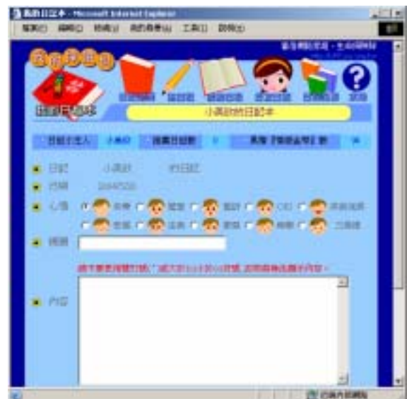
【圖七】我的探險包/我的日記本圖

■ 探險隊基地：此為提供學習者在社會互動情境中學習的社群功能區，同時也是個人學習歷程的檔案紀錄區，內有「隊員討論區」、「情緒留言本」、「風雲排行榜」、「加入探險隊」等功能項目。「隊員討論區」提供學習者彼此之間學習溝通、傾聽等社會技巧和網路禮儀。「情緒留言本」提供學習社群練習抒發表達自我情緒、激勵調節他人情緒等情緒智慧的運用。「風雲排行榜」紀錄所有成員的積分與使用各種學習功能次數排名。「加入探險隊」則是新進學習者註冊功能。