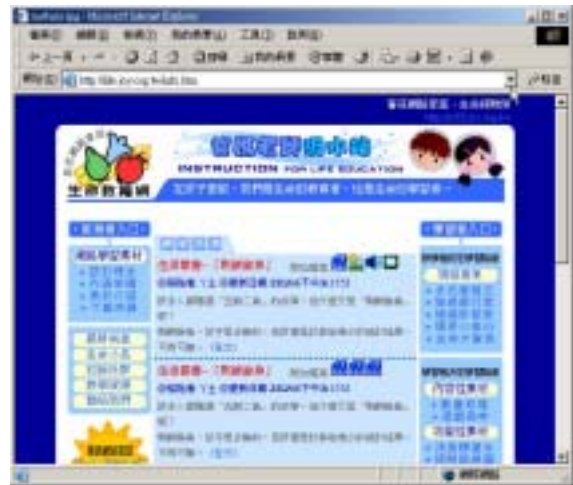
【圖十二】爸媽老師汲水站圖

■ 爸媽老師汲水站：爸媽老師汲水站為供父母老師參考的本站網路學習素材簡介，包括設計理念、內涵架構、素材介紹。另有教學資源、以及爸媽老師社群討論區，供教師家長自修生命教育、分享教養問題的互動區域。