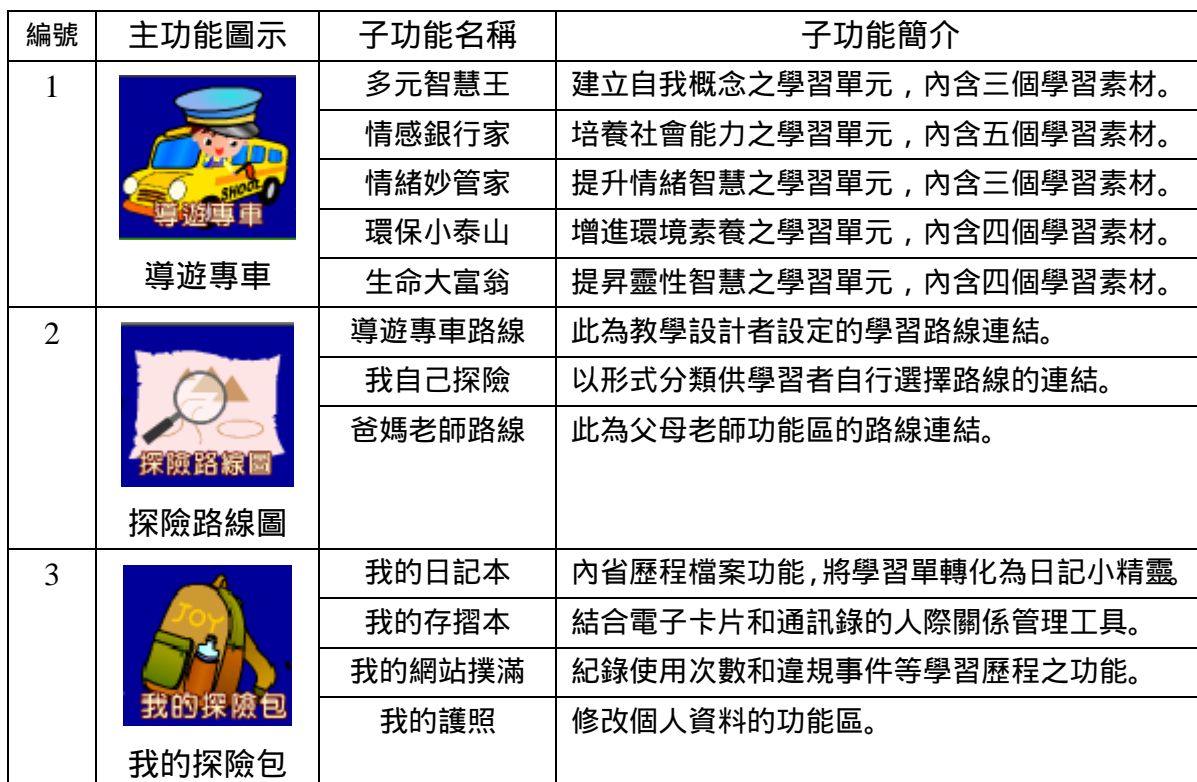
【表一】系統功能簡介一覽表

八個主功能區之下各有一到五個不等的子功能項目，以下僅以列表方式簡示八個功能區的子功能項目如下（表一）：