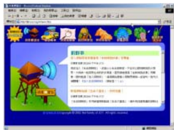
【圖十一】消息瞭望台圖