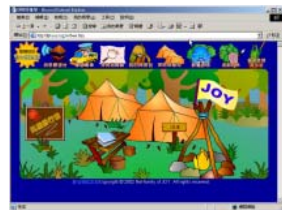
【圖八】探險隊基地圖

■ 探險隊基地：此為提供學習者在社會互動情境中學習的社群功能區，同時也是個人學習歷程的檔案紀錄區，內有「隊員討論區」、「情緒留言本」、「風雲排行榜」、「加入探險隊」等功能項目。「隊員討論區」提供學習者彼此之間學習溝通、傾聽等社會技巧和網路禮儀。「情緒留言本」提供學習社群練習抒發表達自我情緒、激勵調節他人情緒等情緒智慧的運用。「風雲排行榜」紀錄所有成員的積分與使用各種學習功能次數排名。「加入探險隊」則是新進學習者註冊功能。