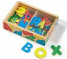
磁性玩具 (如:字母磁鐵)