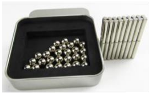
磁性玩具 (如:巴克球益智磁鐵組)