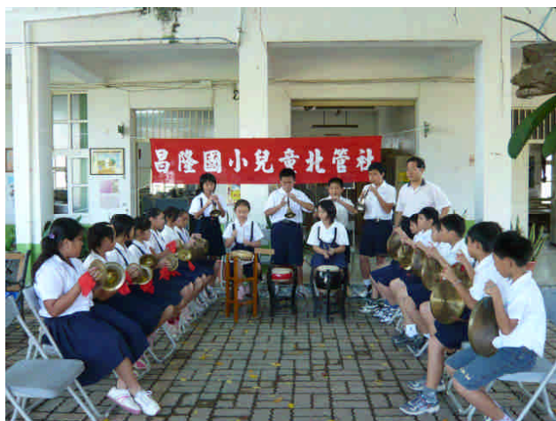
96.10.04 民眾日報報導兒童北管