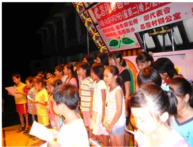
96.09.25 中秋晚會同學齊唱客家歌謠