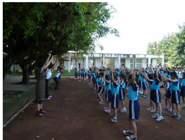
全校師生~身體導引