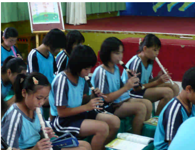
每一位同學都要會吹直笛