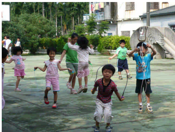
一年級新生學習跳繩