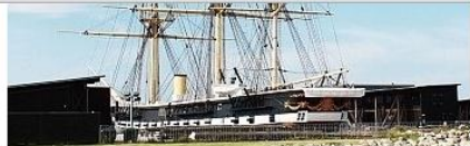
世界最長木船，日德蘭戰船（Fregatten Jylland）颯爽英姿。