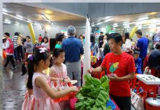
【照片說明】新北假日小農夫市集活動