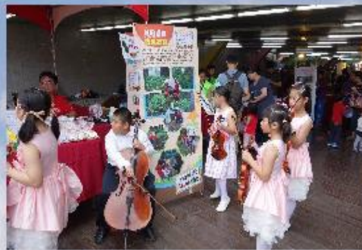
【照片說明】新北假日小農夫市集活動