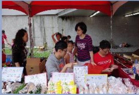
【照片說明】新北假日小農夫市集活動