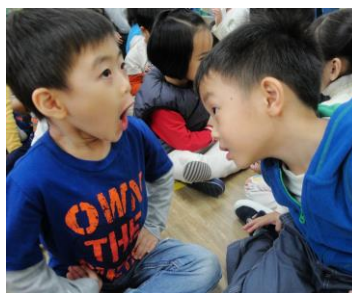
觀察嘴巴，看得真仔細