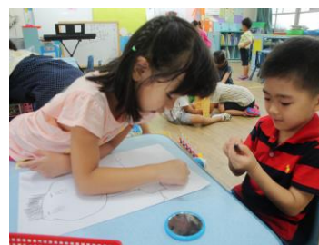
孩子相互討論給予建議

在自畫像活動中，孩子常常不了解自畫像的意義，而畫成平常喜歡畫的公主或畫得過小，這次老師試試拿鏡子一步步示範如何畫出自己，有了示範加上實作時的引導，看到小朋友認真地照著鏡子畫，大部分的孩子都能清楚地畫出大大的人、五官、自己的穿著…，甚至眉毛、耳朵、鼻孔等小細節，細細的筷子人少了，舊生與中班相較也成熟不少，有手指頭、衣服上的圖案、頭髮綁起來的樣子…！