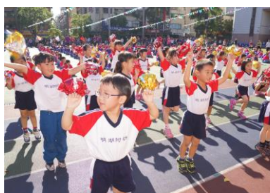
小浣熊活力進場、魅力四射