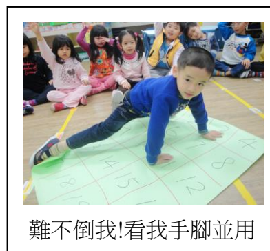
難不倒我!看我手腳並用