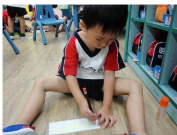
寫下自己想到的新名稱

習區取名字。老師將各學習區的照片及名稱貼在海報上，並強調「每個學習區有不同的玩具，小朋友做的事情也不太一樣，我們幫忙取的名字要讓大家知道在這個學習區裡面是要做什麼事情的。」。