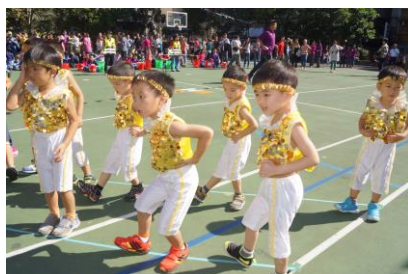
體操表演精神百倍、熱情滿分