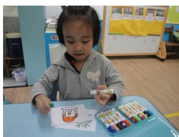
幫忙畫出美勞區的東西

接著，孩子們自由進行分組，選擇自己想要佈置的學習區，幫忙描寫名稱和畫圖，並將寫好的文字及圖畫剪下來貼在適合的位置。每一組的工作進度不同，較快完成佈置的孩子可以協助其他組，或是扮演垃圾車的角色，穿梭各組協助收拾地面及桌面的紙屑。