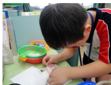
明信片上要貼收信人喔