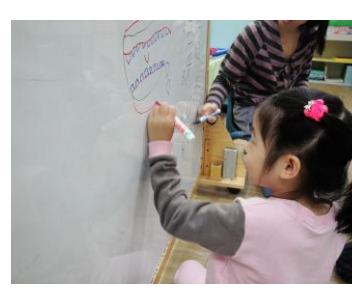
畫下所看到的嘴唇