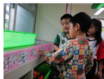
欣賞大家完成的佈置