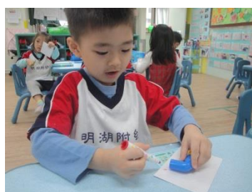
拿著積木描出形狀