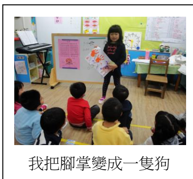
我把腳掌變成一隻狗