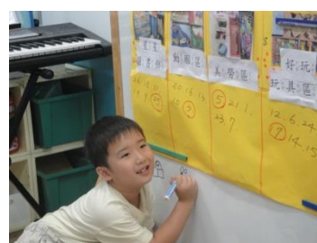
畫畫看要用什麼圖案來代表動腦區

確定學習區名稱之後，接下來孩子們就準備分工合作開始佈置環境囉！首先，我們要如何讓小朋友知道每個學習區的位置和名稱呢？孩子們提議可以用寫的，這時候老師提出了一個問題：「寫字是個好主意，不過有些小朋友看不懂字，那要怎麼辦呢？」，有人說可以加上注音，有人說可以用畫的。於是老師邀請孩子們出來畫畫看，每個學習區要用什麼樣的圖案來表示：畫一個人在看書代表星星圖書館、畫了兩個象棋代表動腦區…在討論的過程中，老師發現孩子們發揮了十足的想像力和觀察力，而且選擇的圖案都具有代表性呢！