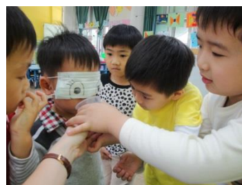
好鼻師～輪流試試看