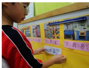
把新名字貼在海報上