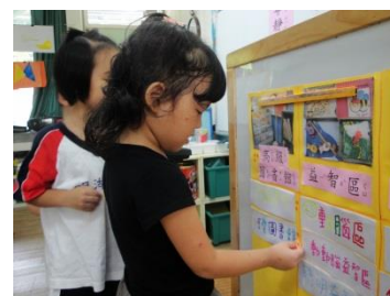
大家一起貼點點來投票

經過幾日的思考，孩子們陸續有了新的想法：益智區可以改成動腦區，因為到這邊要動動腦才可以玩；小廚房可以改成厲害廚房，因為要很厲害才不會被燙到和切到…小朋友的創意無限，接連迸出了好幾個有趣的新名稱。老師請孩子將想到的新名稱寫在紙條上，並貼在對應的學習區照片下方，接著透過票選活動，由每位孩子投下神聖的一票。就這樣，浣熊班全新的學習區名稱出爐了：星星圖書館、動腦區、美勞區、好玩玩具區、小小廚房。