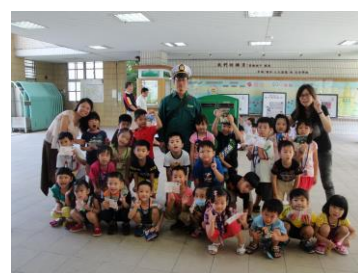
我會寄明信片！謝謝郵差叔叔