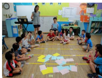
拿著自我介紹卡介紹自己

邁入第三週小朋友們認識了很多新朋友、玩得很開心可是彼此卻叫不出名字，我們便透過簽到、故事、遊戲、寫畫和介紹自己等方式相互認識。