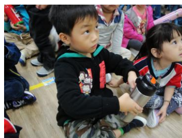
我用四隻手指頭努力抓

繪本「手和手指頭」運用了一些動作讓我們更認識「手」，我們讓每隻手指頭都去找其他四隻手指頭當朋友，小朋友發現大拇指最容易碰到其他手指，於是我們請孩子嘗試不用到大拇指把正在喝的水壺拿去放好，孩子們紛紛說好難喔，認真地想辦法要把水壺拿起來，有的用兩手手掌扶著、有的應用到兩手手腕、有的將水壺放在手掌上平衡…，幾位孩子還很聰明地運用水壺的手把或繩子勾著，然後小朋友說要挑戰不用大拇指拿午餐、玩玩具、鋪棉被…，真有趣！體驗了一整天，隔天小朋友分享“大拇指休息一天更有活力了”、“覺得很不方便、拿東西不穩”…，原來每隻手指頭都很重要，相互合作、少了誰都不行！手還可以幫助我們做什麼事呢？有了經驗孩子說“拿穩東西”，還有“捏東西”、“做勞作”、“搔癢”、“玩遊戲”…，我們把眼睛蒙起來，小朋友很快就用手摸出是什麼物品，課後幾位孩子玩出興趣相互蒙眼、四處找物品給同伴摸一摸猜一猜，原來手也可以感覺物品的特色和不同。