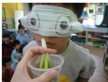
聞聞看這是什麼東西