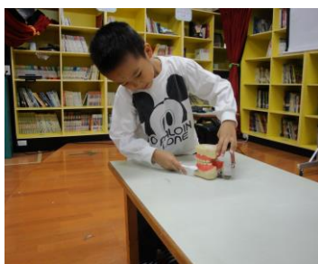
全園牙齒保健宣導活動

上週五健康活動宣導牙齒保健的重要性的方式，於是我們接著認識嘴巴。嘴巴包含了什麼呢？孩子馬上說牙齒，倆倆相互觀察後，小朋友很認真地數了朋友有幾顆牙，許多人數出上面十顆、下面十顆，共二十顆牙齒，老師以文字記錄下來並請孩子畫在白板上，接著孩子還觀察到舌頭、牙肉（牙齦）、口水、嘴唇，一起完成一個大嘴巴，還有觀察細微的孩子說到“喉嚨”、還說有兩個洞，進一步請小朋友觀察，發現當出聲音時喉嚨有一個垂下來的肉肉會動，於是老師畫圖與孩子解說氣管和食道，也藉機讓孩子知道吃東西時要專心，以免食物跑到氣管是很危險的，果然午餐時大家都安靜地用餐；最後討論到嘴巴會幫助我們的事，孩子提到吞口水，口水對我們也是很重要的喔，在吃東西時它會分泌一種東西幫助我們東西更好吃、也幫助我們消化食物，孩子們吃飯時紛紛細嚼慢嚥，還說“飯真的甜甜的耶”！我們從孩子的觀察和發現中一起學習。