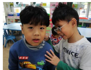
你有仔細觀察過耳朵嗎

相互觀察耳朵時，小朋友發現耳朵有洞、有細細的毛、垂下來的肉肉(耳垂)、耳朵上面有摺起來的樣子、耳背有細細紅紅紫紫的血管、有耳骨但是是軟軟的，還有耳屎，有了鼻子和眼睛的經驗，小朋友說耳屎就是把髒東西包起來，除了聽聲音之外，還有小朋友說耳朵上的毛可以擋住灰塵，老師也分享除了灰塵有時候也會有小蟲不小心跑進去，老師還分享了螞蟻跑進耳朵的經驗，