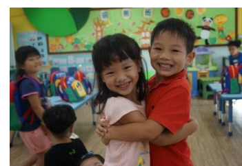
我們都要相親相愛

孩子們越來越熟悉，彼此之間的互動也越來越頻繁，難免在生活上發生一些小摩擦。雖然老師經常提醒孩子們要注意禮貌，但孩子之間的小爭執似乎還是沒有減少的跡象，如：有人走路不小心撞到別人、有人坐錯位子被大聲提醒、有人開玩笑的打人家的頭…。面對這樣的情況，浣熊老師決定和孩子們召開班會討論「如何解決這些吵架的問題」。