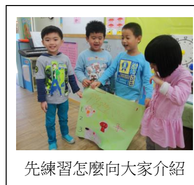
先練習怎麼向大家介紹

完成後我們決定拿著海報當「身體小博士」向其他班的老師、小朋友介紹身體重要的器官，但是在這之前我們得先練習，每一組輪流向大家介紹，小聽眾再給予建議，孩子發現如果一直笑會讓觀眾聽不清楚、一次一個人說大家才聽得清楚、音量大聲一點、也要小心不要