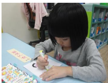
描寫規則、畫出規則

因為與自己切身相關，孩子很努力地思考如何適當地與同儕互動，並且是具體可以做到的，一起分組合作描寫並畫出討論出來的規則，照著順序和圖文排列配對張貼於老師事先貼在各區的波浪板上，孩子就在老師稍加協助下完成學習區規則的討論和呈現了！往後在學習區活動的爭執減少、即使發生不愉快孩子也能學習如何解決。