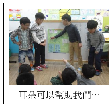
耳朵可以幫助我們…