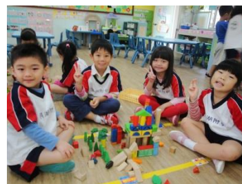
開心的學習區時間

老師請孩子們分享在學習區裡面遊戲的經驗：高級圖書館可以看書、益智區可以玩跳棋、美勞區可以剪紙、玩具家可以玩積木、小廚房可以玩煮菜的遊戲…看來，孩子們都清楚知道在學習區裡可以做的活動有哪些。不過，老師在孩子們的討論中發現小朋友對於學習區的名稱並不熟悉。於是，提議讓孩子們自己幫學