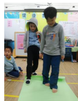
小心翼翼地踩踩看