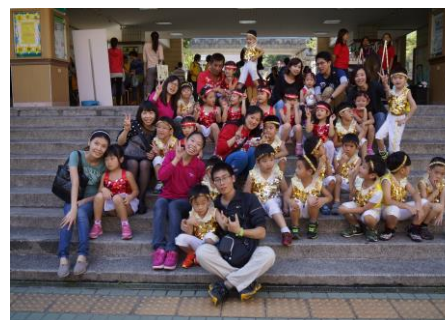
表演順利結束，大家好棒棒