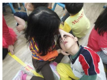
看清楚鼻孔裡面的東西

蘋果、西瓜、蛋糕、巧克力、蔥、薑、蒜頭)，孩子的嗅覺很厲害，把各種神秘小東西全部猜出來了。