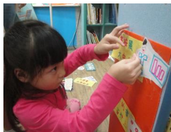
排列順序、文圖配對貼好